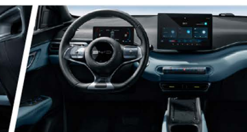
Sistema de Cabina Inteligente BYD