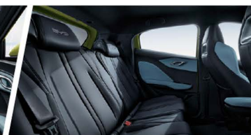
Espacio Interior Optimizado