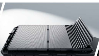
Ultra-Safe Batería Blade