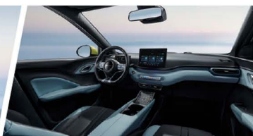
Cabina Ocean Chic