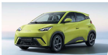
300KM / 380KM NEDC de Autonomía ①