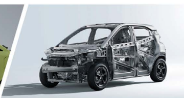
Estructura Corporal de Alta Resistencia