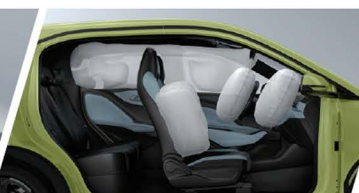
Equipado 4 / 6 Bolsas de Aire